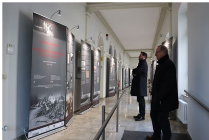
Die Ausstellung im Verwaltungsbau ist noch bis zum 14. April zu sehen, der Eintritt ist frei.

i: Die Ausstellung ist noch bis 14. April täglich von 9-17 Uhr im Verwaltungsbau des ZfP Südwest in Zwiefalten zu sehen, kostenfrei und frei zugänglich . Mehr Informationen zur Ausstellung und zu möglichen Führungen gibt es telefonisch unter 07373-10-3113 oder 07373-10-3845. Das Ausstellungsprojekt des Württembergischen Psychatriemuseums wurde mit Mitteln der LEADER-Aktionsgruppe Mittlere Alb gefördert.