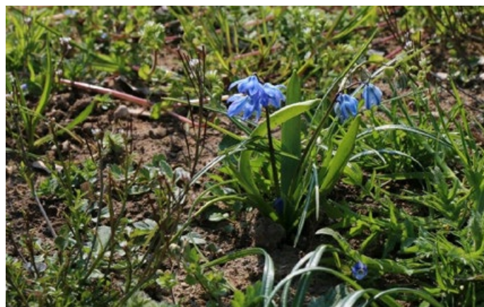
Wilde Frühblüher wie der Blaustern bieten Schmetterlingen und Wildbienen schon früh im Jahr den für sie so wichtigen Pollen und Nektar.