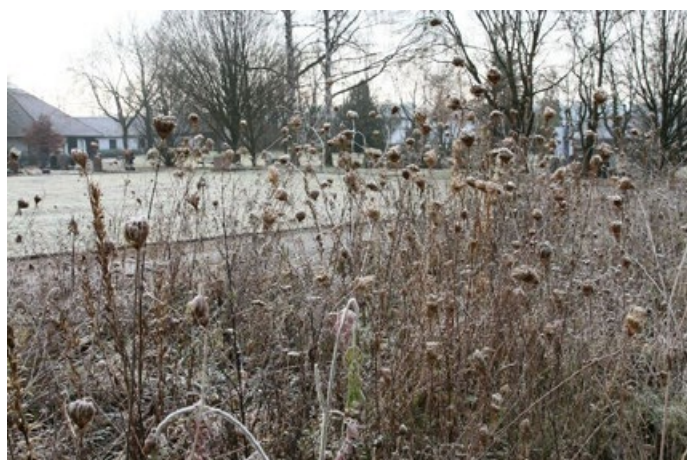
Struppige Wildstaudenfläche im Winter: Die Samen in den vertrockneten Blütenständen bieten Vögeln Nahrung und in den Stängeln richten Insekten ihre Nistquartiere ein.

Zwiefalten hat im Rahmen des Kooperationsprojekts „Natur nah dran“ des NABU und des Ministeriums für Umwelt, Klima und Energiewirtschaft Baden-Württemberg sechs Grünflächen in wertvolle Biotop mit Wildpflanzen umgewandelt. Diese liegen an folgenden Standorten: am Hang an der Realschule, in der Mauerstraße entlang der Mauer und neben der Bushaltestelle, beide Verkehrsinseln an der B 312 (Steige) Richtung Gauingen und an der Verkehrsinsel nach Baach.