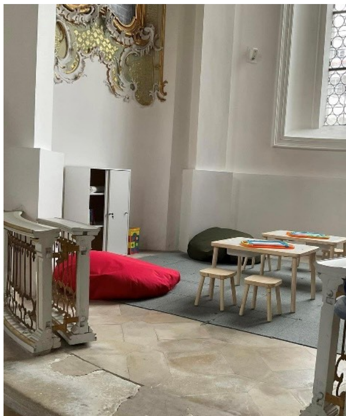
Die Kinderecke ist zu allen Gottesdiensten, die ab sofort im Münster stattfinden geöffnet.