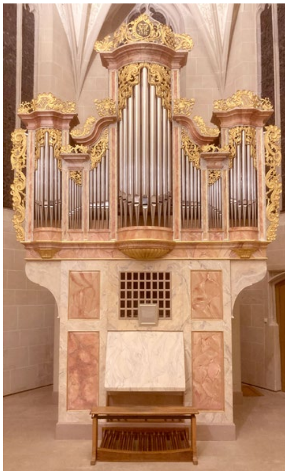
Die frisch renovierte Orgel der Martinskirche Münsingen