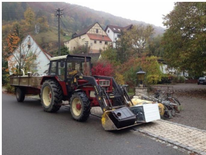
Schrottsammlung der Kolping-Fanfarenzug Zwiefalten

Vielen Dank schon einmal im Voraus für Eure Unterstützung