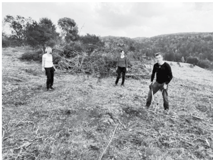
Jede Menge Restholz und Sträucher wurden haufenweise abgelegt zur weiteren Verarbeitung.