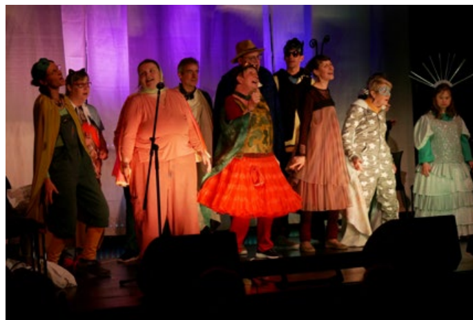
Die „Superheroes“ auf der Bühne des franz.K.