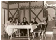
Theatertradition seit 1908!