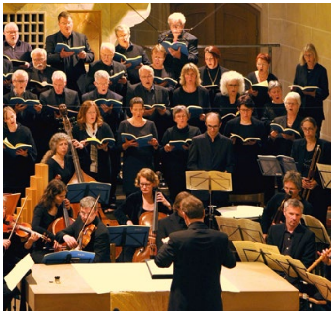
Der Kammerchor im Jahr 2017

Am Sonntag, 12. Februar, findet in der Martinskirche Münsingen um 17 Uhr ein Chorkonzert des Kammerchors der Martinskirche statt. In den letzten beiden Jahren musste der Chor coronabedingt pausieren, weshalb keine Konzerte stattfinden konnten.