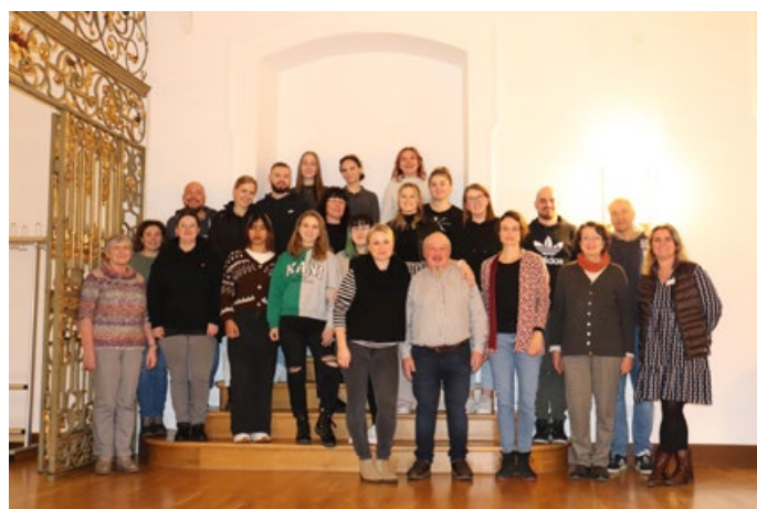
Auszubildende und Projektverantwortliche freuen sich über eine erfolgreiche Azubistation in Zwiefalten.

Bei der abschließenden Plenumsdiskussion stand dann der persönliche Rückblick der Hauptakteur:innen im Mittelpunkt. „Ich bin sehr erleichtert und stolz und habe trotz anfänglicher Selbstzweifel nun ein gestärktes Selbstvertrauen“, resümierte eine Auszubildende. Als besonders wertvoll empfand eine andere den Austausch, flache Hierarchien auf der Station und die Zusammenarbeit im multiprofessionellen Team. „Trotz vieler herausfordernder Situationen haben wir den Spaß an der Arbeit nicht verloren“, ergänzte eine Kollegin. Das bestätigte auch das von den Auszubildenden vorbereitete Video, das ebenso humorvolle wie ernste Einblicke in die Aufgaben und den Arbeitsalltag bot. „Bleibt gelassen, unterstützt euch gegenseitig – es wird eine tolle Erfahrung“, gab die Gruppe als Tipp den Auszubildenden des Mittelkurses mit auf den Weg. Für sie steht das Projekt Azubistation im nächsten Jahr an.