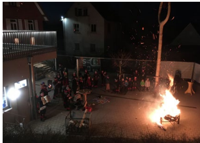
Der Deifel auf dem Scheiterhaufen